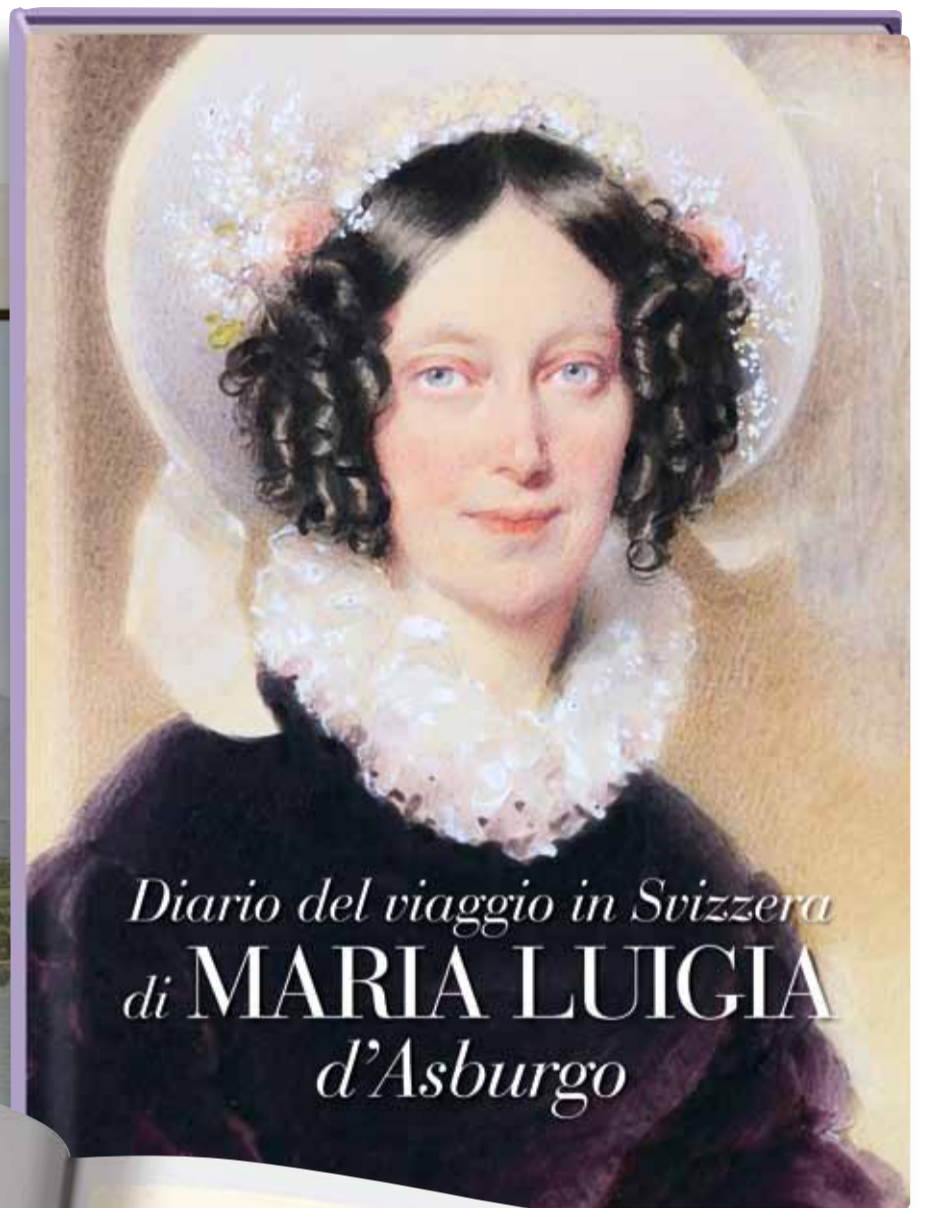
Diario del viaggio in Svizzera di MARIA LUIGIA d'Asburgo