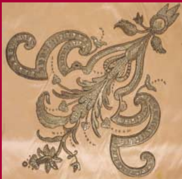
Fondazione Museo "Claudio Lombardi" - Parma