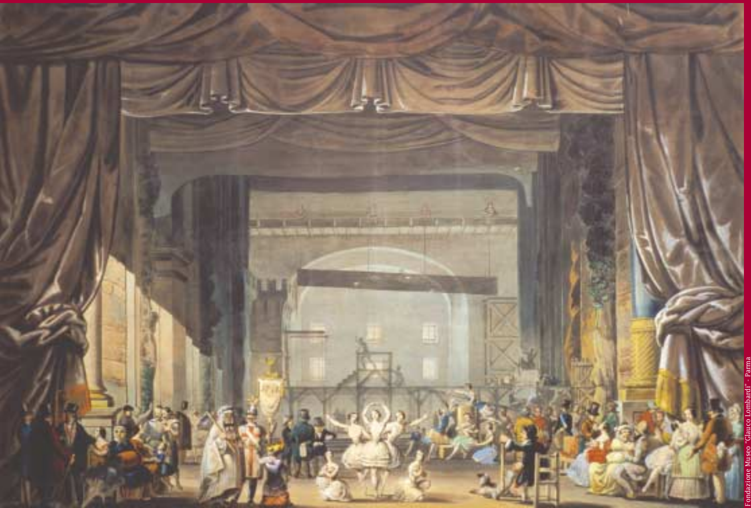
Fondazione Museo "Glaucio Lombardi" - Parma

ziarsi il popolo la "Marie-Louise" parigina si firma con un ruffiano "Maria Luigia". Impara la nuova lingua e tenta anche di conoscere il dialetto, parlato dai nobili; scrive continuamente lettere, soprattutto ai familiari, passando per grafomane. C'è flirt con i parmigiani: