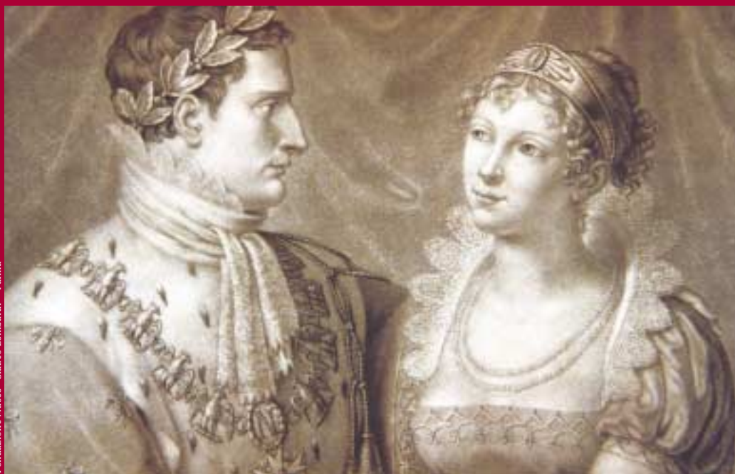
Fondazione Museo "Claudio Lombardi" - Parma

Un'incisione di Giovanni Bigatti rappresentativa dell'iconografia napoleonica. Nella stampa Maria Luigia e Napoleone sono ritratti con tutti gli emblemi caratteristici del ruolo imperiale