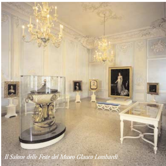
Il Salone delle Feste del Museo Glauco Lombardi

Neipperg, immortalato in un busto in marmo, opera di Bartolini. Diversi oggetti illustrano le passioni di Maria Luigia: lettere e diari di viaggio, acquerelli (alcuni dipinti da lei stessa), aventi per soggetto mete turistiche (da Firenze a Napoli, dalla Svizzera all'Austria), immagini dei suoi numerosi cani, ricami e lavori di cucito, abiti, gioielli, ventagli. Tra le curiosità, una ciocca di capelli biondi di una giovanissima Maria Luigia.